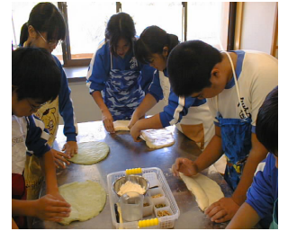
こもればの里 パン作り体験

加子母大杉(かしもおおすぎ)は中津川市加子母にある杉の名称。根回り20m・胴回り13m・高さ30.8mの巨木です。1924年(大正13年)12月9日に、「加子母のスギ」として国の天然記念物に指定された。完全な独立して生えている為、良く目立つ。国道257号からもその姿を見ることが可能。